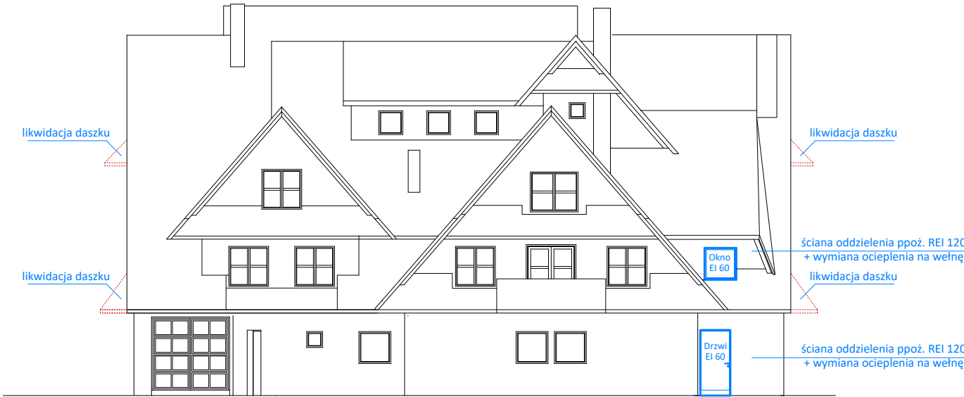
PRZEDMIOT RYSUNKU EL. PÓLNOCNA