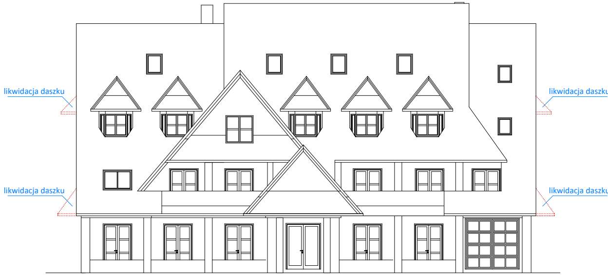
PRZEDMIOT RYSUNKU EL. POŁUDNIOWA